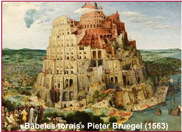
«Bābeles tornis» Pieter Bruegel (1563)

Daudzreiz cilvēki ir izteikuši vēlēšanos celt sev pilsētu ar torni, kura virsotne sniegtos debesīs. Vēsturē mēs arvien atpazīstam cilvēkus, kuri gribējuši veidot pēc sava uskata patiesas rūpes, bet ne vienmēr pēc šīs lielās cīnīšanās pasaule ir kļuvusi “labāka un skaistāka”. Pilsēta ar torni, kura virsotne sniegtos debesīs, palikusi cilvēces atmiņā tikai kā utopija.