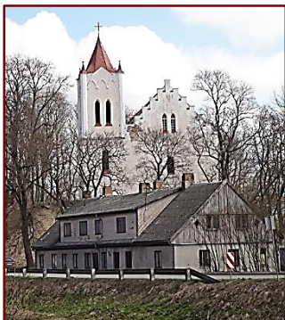
Aizputes Svētā Jāņa ev.lut. baznīca

Ar pateicību, draudzes priekšniece Biruta Neiburga 2016.g. 5. janvārī